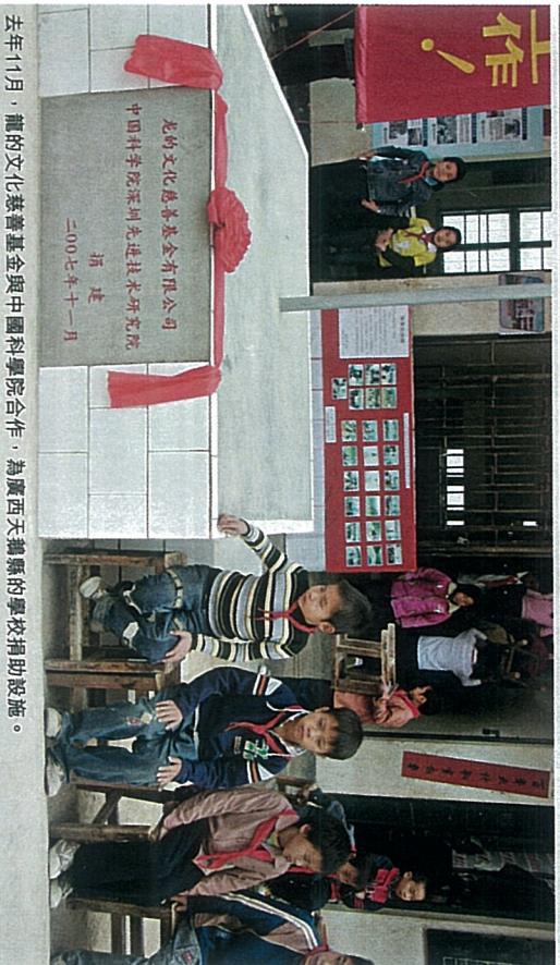
去年11月，龍的文化慈善基金會與中國科學院合作，為廣西天鎮縣的學校捐助設施。

機構合作推出紀念版，每本印刷費約為100元，他願意自行負擔，捐出印刷費和版權費，而籌得的善款，全數撥作重建年初國內雪災毀壞的學校設施。